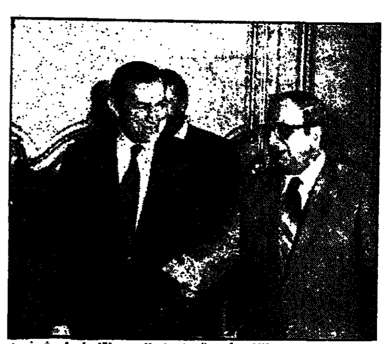
الرئيس ناسون اثناء مأدبة الغداء التي اقامها على شرفه السيد حسني مبارك نائب الرئيس السادات .